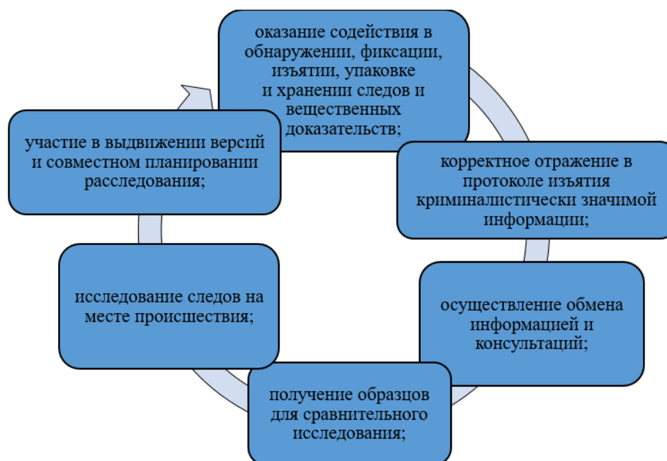
Схема № 2. Формы реализации специальных знаний при производстве следственных действий

Однако, исходя из практики оперативно-служебной деятельности территориальных органов, в большинстве случаев к осмотру привлекаются только специалисты-криминалисты. Это, в первую очередь, обусловлено отсутствием соответствующих специалистов в экспертно-криминалистических подразделениях территориальных органов МВД России на региональном уровне, в том числе из-за кадрового некомплекта, о чем ранее уже отмечалось руководством МВД России 6 .